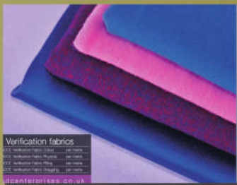
SDC VF 校正布