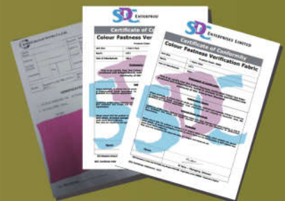
SDC VF 布证书