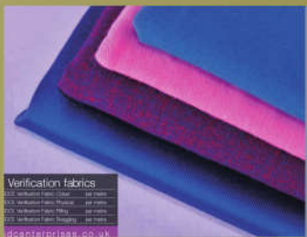
SDCE VF 校正布