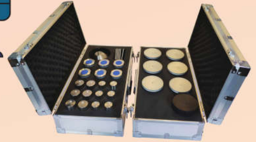
耐磨套件盒 起毛起球套件盒