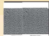
标准评级照片 SM54 Grading photo