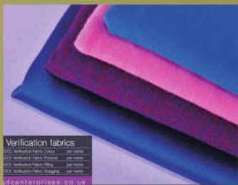
SDC VF 校正布