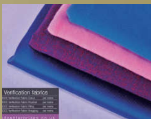
SDC VF 校正布