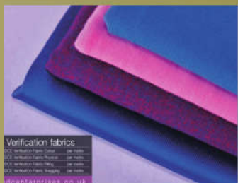
SDC VF 校正布